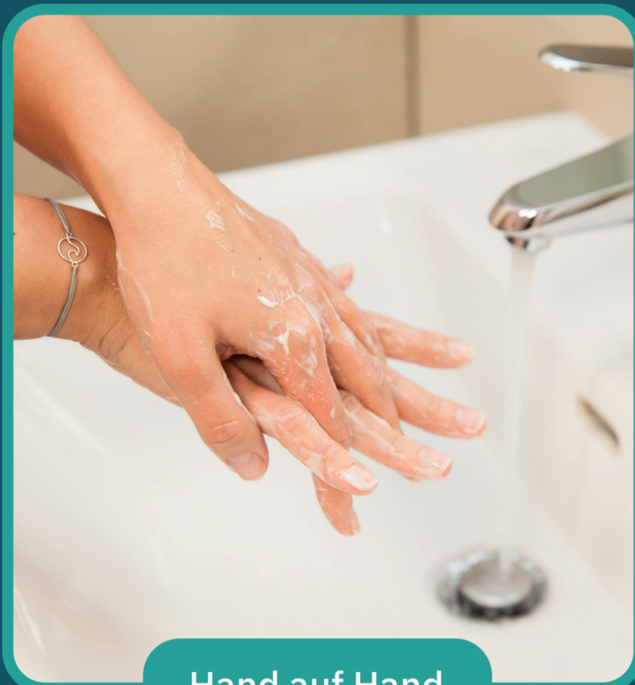
Hand auf Hand