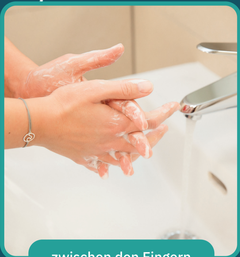
zwischen den Fingern